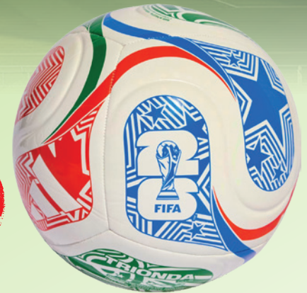
ADIDAS World Cup 26 TRIONDA Club Ball

3x PlastBond 50 ml Doppelkartusche (Art.-Nr. 98350)